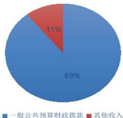
安康市林业局2021年收入结构图